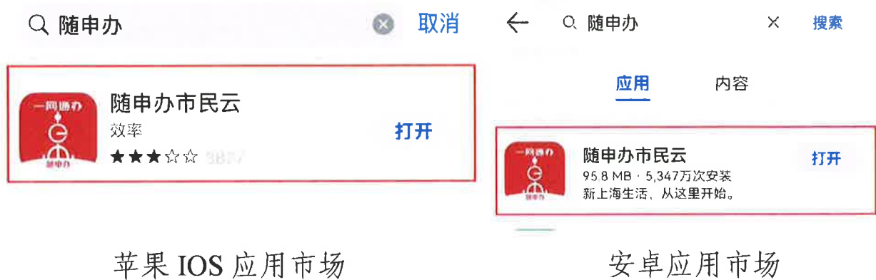
苹果 IOS 应用市场

驾驶员申请人实名登录“随申办”APP（需至苹果 IOS 或安卓手机应用市场下载，如下图）或“随申办”微信小程序、支付宝小程序等移动端服务渠道。