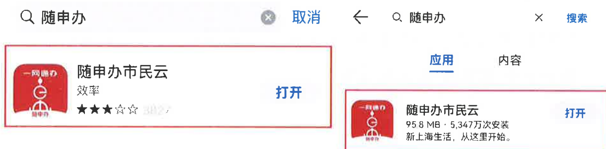
苹果 IOS 应用市场

驾驶员申请人实名登录“随申办”APP（需至苹果 IOS 或安卓手机应用市场下载，如下图）或“随申办”微信小程序、支付宝小程序等移动端服务渠道。